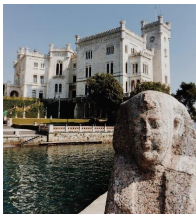
Château de Miramare (Italie)