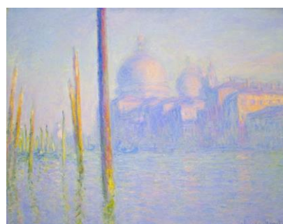
Monet, Venise, Le grand cana