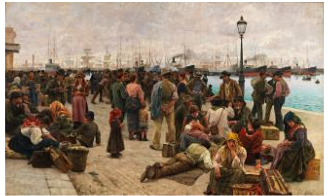
Angelo Tommasi : Gli Emigranti , 1896 Rome, Galleria Nazionale d'Arte Moderna e Contemporanea

Fuyant un contexte économique et politique difficile, 26 millions d'Italiens émigrent vers la France entre 1860 et 1960. Ils formeront sur cette période la première minorité d'immigrants en France. Dans un premier temps, ils sont issus des régions proches de la frontière française, puis de l'Italie méridionale après la Seconde Guerre Mondiale. Ils sont mouleurs, maçons, mineurs, agriculteurs, ouvrières textiles. Ensemble, ils tiennent des commerces, des cafés et des restaurants. Qu'ont-ils gardé de leur italianité ? Comment les Français perçoivent-ils ces "macaronis" ? A travers le récit de différents destins d'immigrés, nous remonterons aux racines italiennes de nombreux Français et Acfdiens !