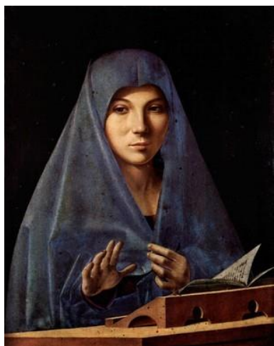
Vierge de l'Annonciation , c 1475, Palerme, Galleria regionale di Palazzo Abatellis

Lors d'un séjour à Venise en 1474-76, il eut des échanges extrêmement fructueux avec les peintres vénitiens dont Giovanni Bellini, à qui il fit découvrir la technique à l'huile : il y réalisa ses plus beaux chefs-d'œuvre qui continuent de nous émouvoir par leur douceur et leur sensibilité, et dont les effets de flou lumineux dus à son emploi de la peinture à l'huile, allaient influencer le chromatisme vénitien et sa « révolution tonale ».