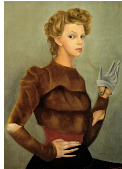
Léonor Fini - Autoportrait au scorpion

Suivez le parcours d'une créatrice multiple, sorcière, prêtresse et souveraine, passionnément italienne.