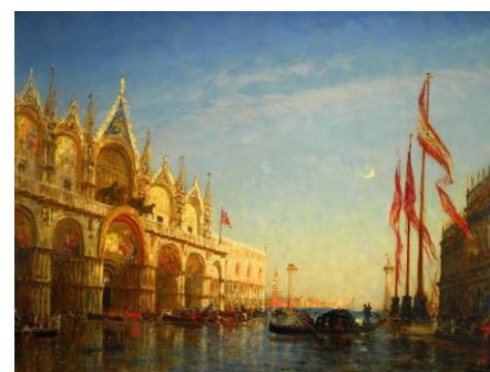
Félix Ziem, La Place Saint Marc inondée

19 ème siècle : de Félix Ziem aux Impressionnistes, de Whistler à Sargent, de Manet à Monet