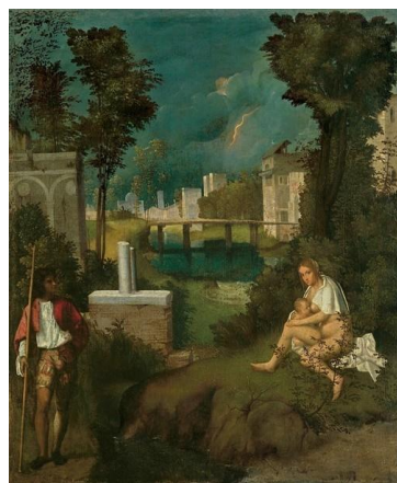
La tempesta , 1508, Accademia de Venise

Il a également inventé une nouvelle conception du paysage par des œuvres énigmatiques et mélancoliques. A sa mort en 1510, Titien termina certaines de ses œuvres inachevées, comme la célèbre Vénus de Dresde.