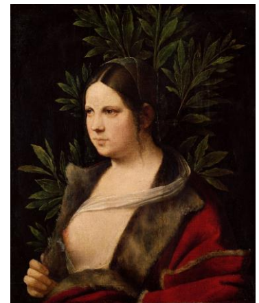
Laura 1506, Vienne