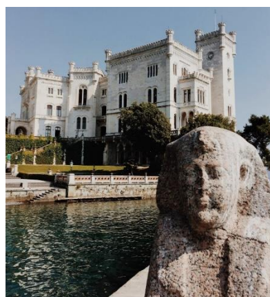
Château de Miramare (Italie)