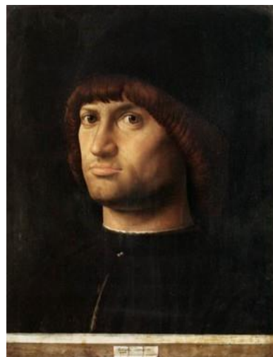
Le Condottiere , 1474-1476, Musée du Louvre.

Antonello est le premier grand portraitiste italien, qui excelle dans des portraits novateurs par leur qualité psychologique, par le traitement de la lumière et du coloris, mais aussi par leur puissant réalisme.